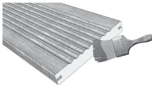
Ambas as extremidades da placa de bambu são tratadas com selante à base de água, para evitar que absorva água. Caso seja necessário corte durante a instalação, recomenda-se a aplicação do selante ou cera na superfície do corte.