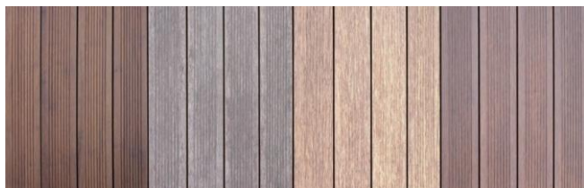
Após Instalação 2 anos de utilização Após Limpeza Após Manutenção