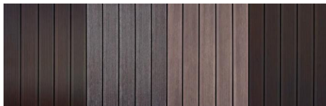
Após Instalação 2 anos de utilização Após Limpeza Após Manutenção